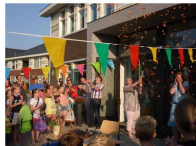
Het was een feestelijk welkom maandagmorgen 31 augustus

Na het afronden van mijn studie aan de PABO heb ik Onderwijspedagogiek gestudeerd. Daar de dagelijkse klassenpraktijk mij erg trok, heb ik meerdere jaren lesgegeven diverse groepen op de basisschool in Leidschendam en Den Haag. Daarnaast ben ik intern begeleider geweest. Sinds 2007 wonen wij in Noord-Brabant, waar ik gewerkt heb als ambulante begeleider vanuit de Mytyschool Tilburg. Hier ben ik ook twee jaar teamleider geweest in het VSO, afdeling VMBO. Daar het reguliere basisonderwijs mijn interesse bleef houden, ben ik in aug 2012 gestart bij De Eenbes, als directeur van Brede school De Muldershof in Beek en Donk.